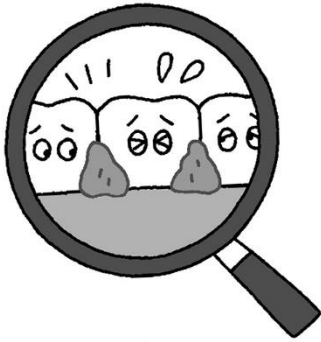
歯肉炎の原因は、歯と歯肉の境目にたまった歯垢