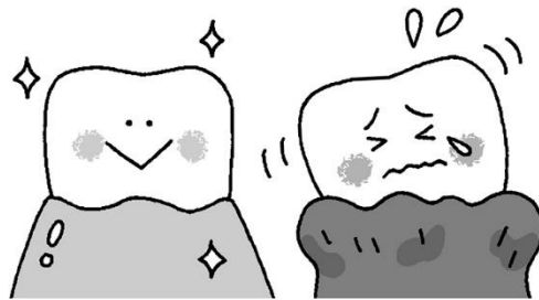
健康的な歯肉は薄いピンクで引き締まっている。歯肉炎の歯肉は赤く腫れてブヨブヨ