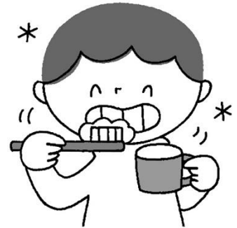
丁寧なブラッシングを続けることで改善できる